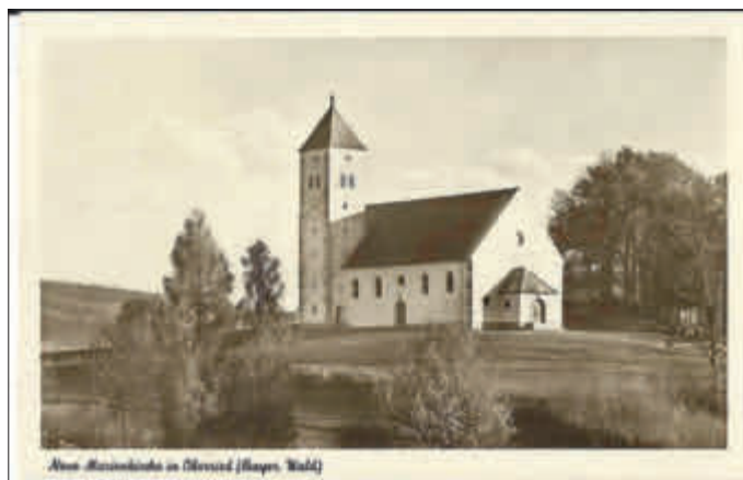
Alte Mariäkirche in Oberried (Bayer. Wald)