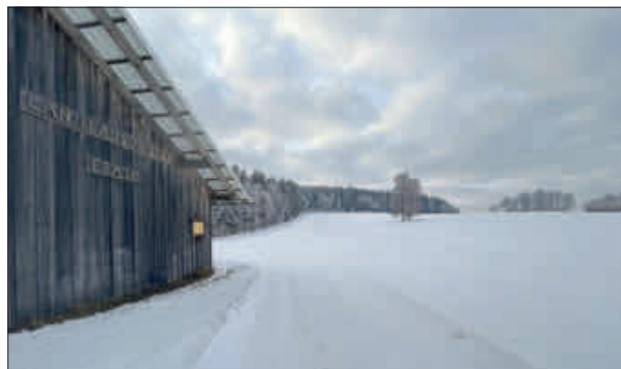
Langlaufzentrum Frath - 30.01.2026

Im Langlaufzentrum Frath herrschten überwiegend gute bis sehr gute Bedingungen, auch wenn die Waldpassagen teils schneefreie Stellen aufwiesen. Im Laufe des Februars wurden - sowohl Frath als auch die Auerhahn-Höhenloipe - die Loipen nochmals mehrfach gespurt, solange es die Schneelage zuließ. Dieses Angebot wurde von Wintersportlern sehr geschätzt.