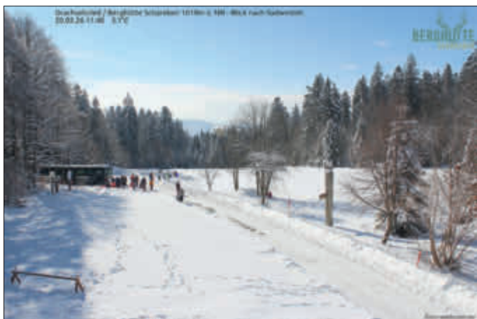
Schareben - 20.02.2026

Der Skibus Zellertal war von 25.12.2025 bis einschließlich 22.02.2026 im Einsatz und wurde wieder gut angenommen. Hauptsächlich diente er als Zubringer zu den Wintersportgebieten Riedlberg und Schareben.