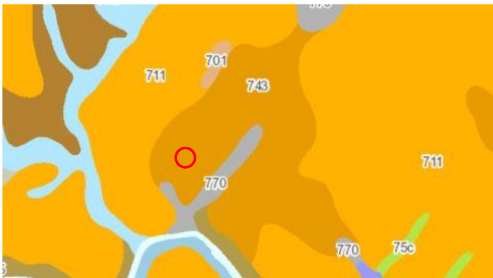
Abbildung 4 Übersichtsbodenkarte

Zusätzlich sind Böden grundsätzlich Standort für die land- und forstwirtschaftliche Nutzung und Archiv der Natur - und Kulturgeschichte. Die dem Planungsgebiet zuzuordnenden Flächen sind ohne bekannte kulturhistorische Bedeutung, im Bestand mit anthropogen geprägtem Boden.