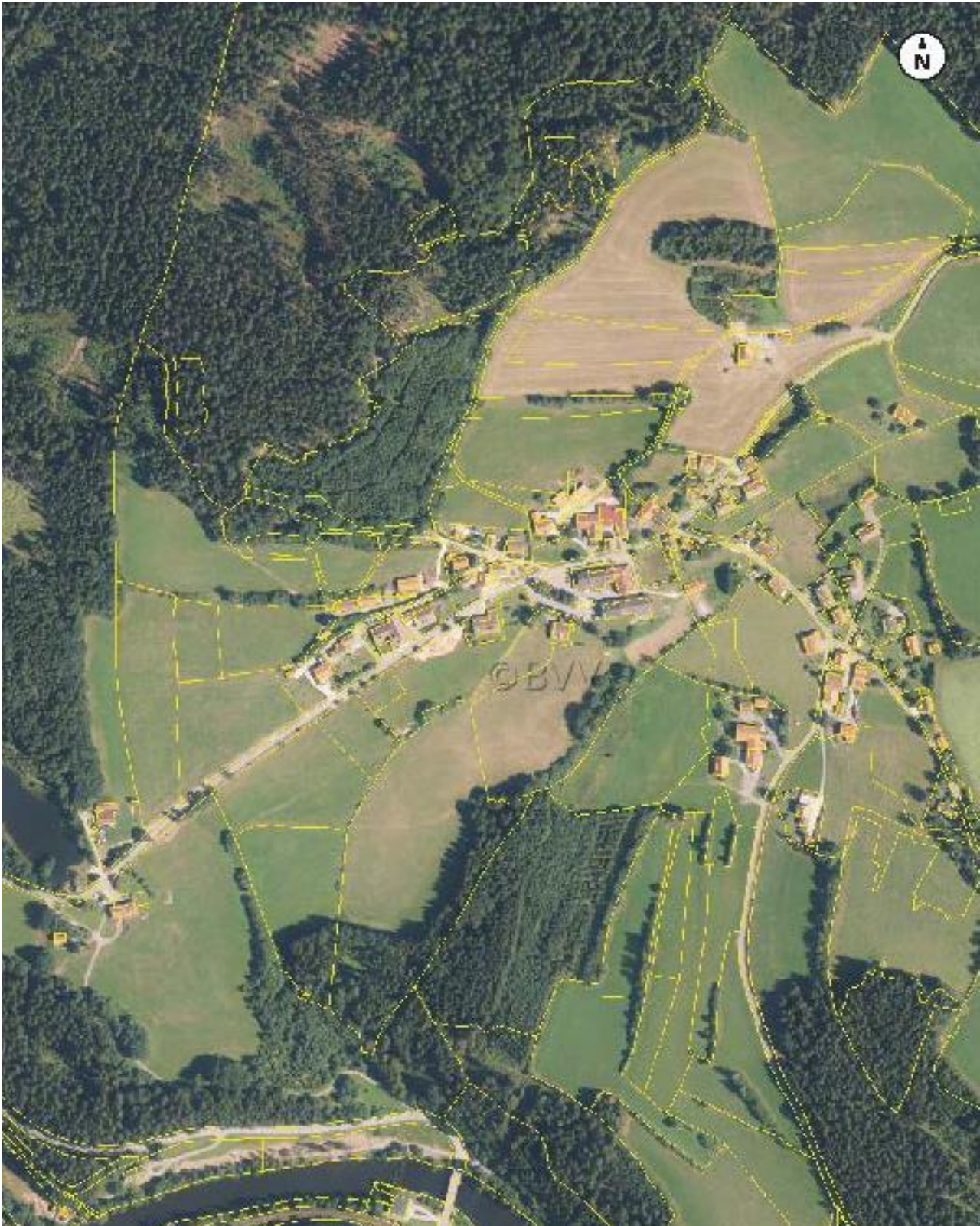
Abbildung 1 Luftbild