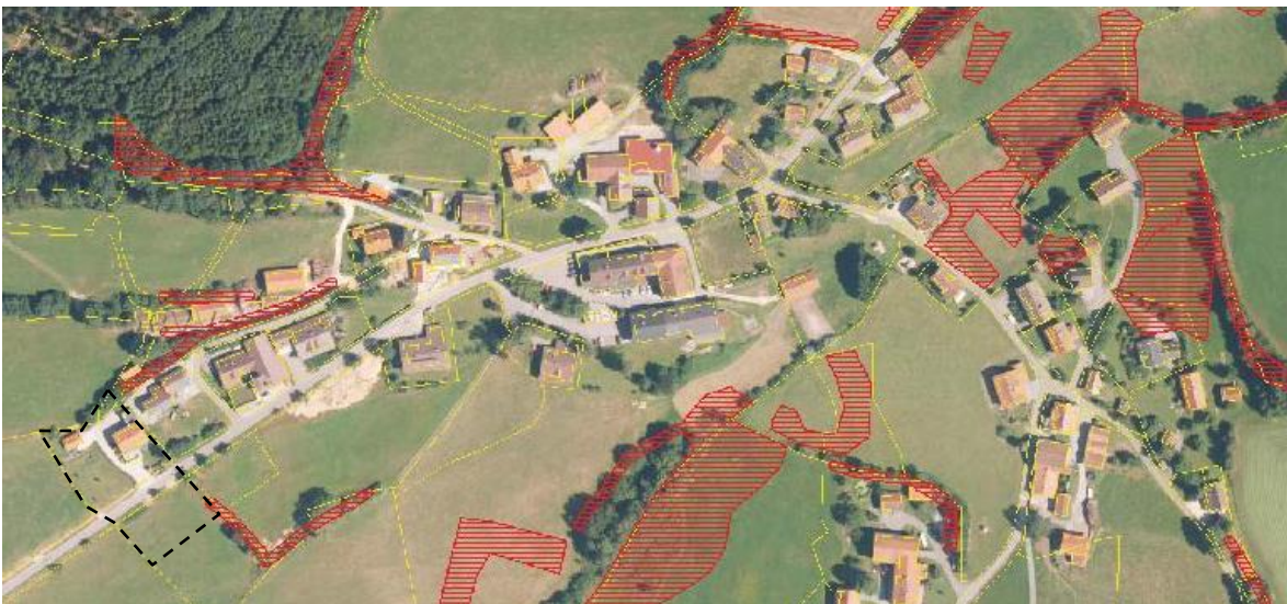
Abbildung 3 Biotopkartierung

Das Plangebiet ist umgeben von landwirtschaftlichen Flächen und reicht durch die Erweiterung mit ca. 1.107 qm ins Landschaftsschutzgebiet Bayerischer Wald hinein. Eine Fläche eines Biotops von ca. 35 qm liegt ebenfalls innerhalb des Geltungsbereichs, das aber unberührt bleibt.