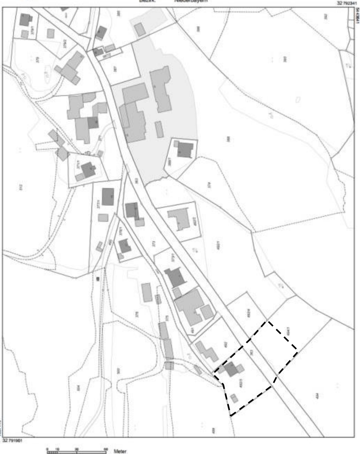
Abbildung 2 Unbeglaubigter Lageplan, von Geoportal Bayern

Gemeinde: Drachselsried Landkreis: Regen Bezirk: Niederbayern