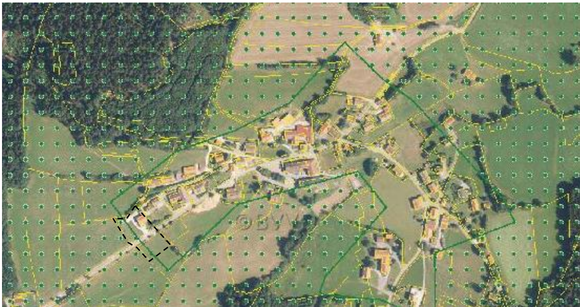
Abbildung 5 Landschaftsgebiet Bayerischer Wald, aus BayernAtlas

Das Plangebiet ist umgeben von landwirtschaftlichen Flächen und reicht durch die Erweiterung mit ca. 1.107 qm ins Landschaftsschutzgebiet Bayerischer Wald hinein. Das Landschaftsbild erfährt durch die Darstellung als Wohngebiet nur geringe zusätzliche Beeinträchtigungen des bereits durch die bestehenden Straßenverbindungen und die umliegenden Gebäude veränderten Landschaftsbildes.