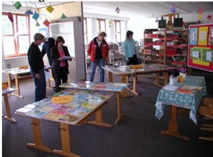
2006: Buchausstellung in der Schule

Seit 2006 nimmt die Grundschule am Leseförderprogramm „Antolin“ teil, monatlich besuchen die Schulkassen die Bücherei zur „Antolin-Ausleihe“. Die eifrigsten Leser werden im Rahmen der Feiern zur Zwischenzeugnisübergabe und zur Jahresabschlussfeier durch die Schule prämiert. Weitere gemeinsame Veranstaltungen: 2006 Vorlesenacht in der Schule und Lesewettbewerb. Zum Welttag des Buches Aktionen in Schule und Bücherei.